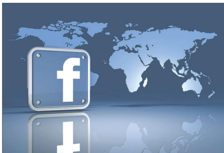
Facebook ist das beliebteste Sozialnetzwerk weltweit.

ren. Normale Menschen werden in Sozialen Netzwerken nicht in Betracht genommen. Nur interessante, falsche Menschen werden als unterhaltend angesehen. Im virtuellen Raum geschieht nicht nur Gutes. Menschenhandel wird überall in der Welt betrieben. Die meisten Informationen über ihre künftigen Opfer bekommen diese Schmuggler aus dem Internet, weshalb man persönliche Infos nie im Internet teilen sollte.