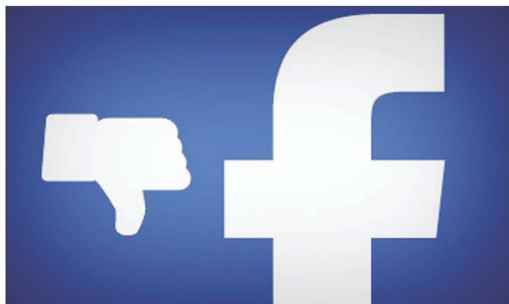
Ein „Missfällt mir“-Knopf wird bei Facebook vermisst.

Die sozialen Netzwerke: Eine revolutionäre Erfindung oder der Beginn des Verfalls?